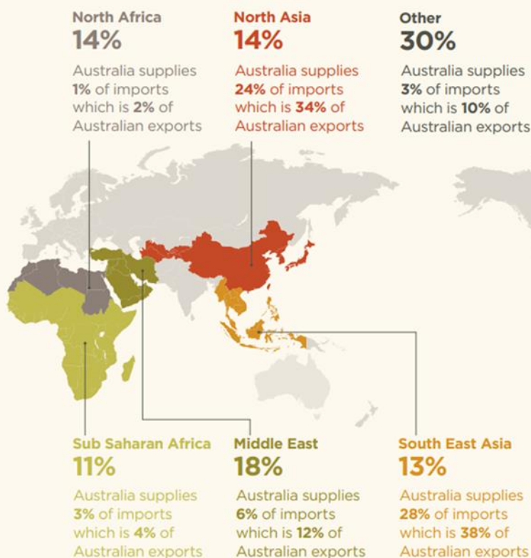
Figure 4.6 World wheat and coarse grain (exc. Rice and Oilseeds) imports and Australian supply (% of world imports)